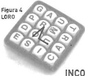
Figura 4 LORO

Para 2 o más jugadores de 8 años en adelante.