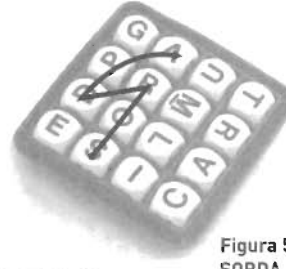
Figura 5 SORDA

En la Figura 4 (LORO), la letra "O" es usada dos veces. En la Figura 5 (SORDA) se han saltado la letra "P"; las letras deben estar contiguas en secuencia.