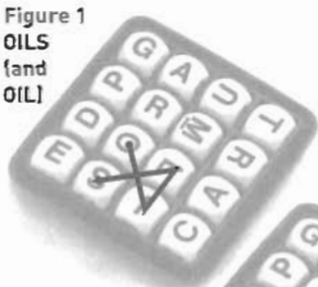
Figure 1 OILS (and OIL)