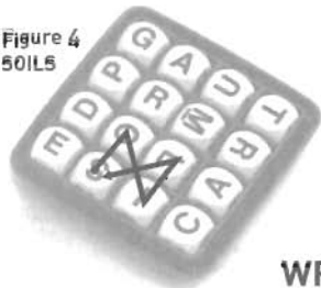
Figure 4 SOILS