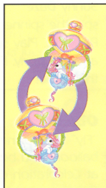
Carta de "Switch Places"