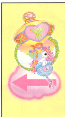
Carta de "Move Back"