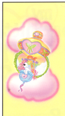
Cartas de "Move Ahead"